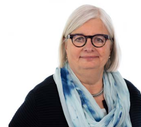
Maartje van Putten (1951)